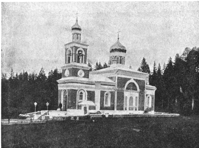
Храмъ с. Неразстаннаго.